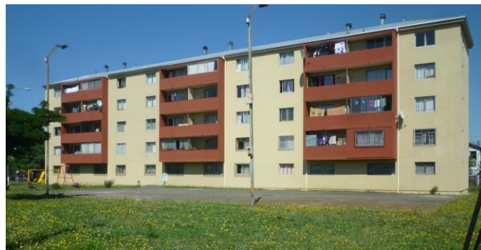
Figura 03: fachada antes del re-acondicionamiento térmico, Condominio Barros Arana. Figura 04: fachada después del re-acondicionamiento térmico, Condominio Barros Arana.